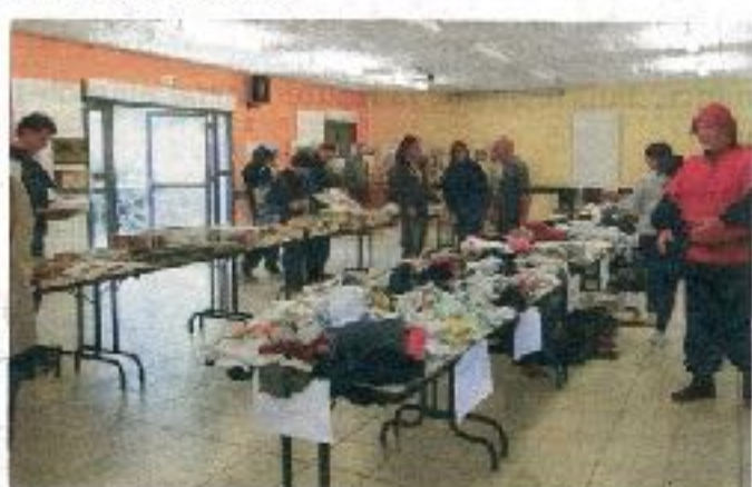
La salle Minel n'a pas désempé de la journée.

Sur une table, des pâtisseries, quelques jus et de quoi grignoter, toujours gratuitement. À l'entrée, des représentants de Médiévalys Chaumont accueillent les visiteurs en tenues d'époque, pas