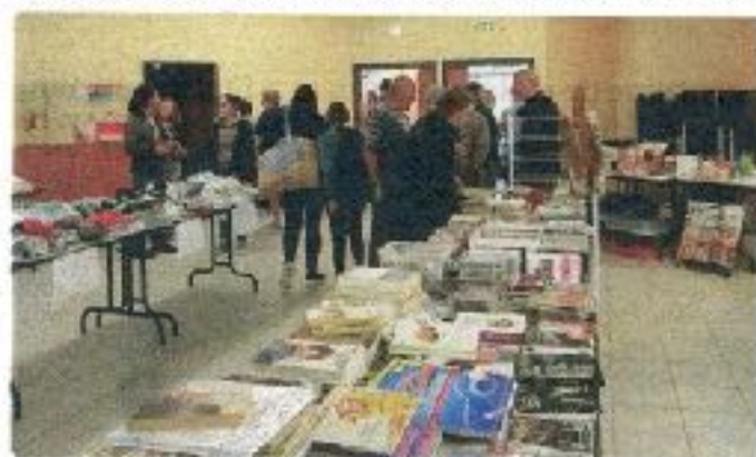
Des livres pour petits et grands qui connaîtront une seconde vie.

ANIMATIONS. La première fête du gratuit ou "gratifieria" a connu un gros succès à Nogent, ce dimanche, avec plusieurs centaines de visiteurs. Une seconde devrait se tenir à Bourbonne, le premier ou deuxième week-end de décembre, sur le thème de Noël.