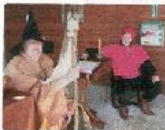
L'association Médiévalys a répondu présent pour l'événement.

Retrouvez la vidéo de l'événement sur www.jhm.fr