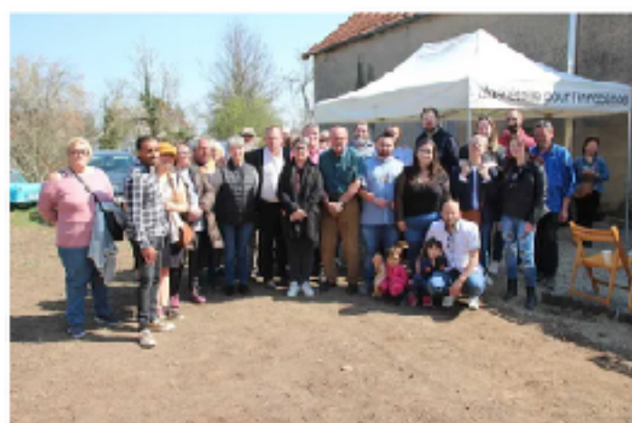
L'association souhaite aider et soutenir les jeunes victimes de différents maux taillés.

L'association Une étoile pour l'innocence a inauguré ses locaux, route de Chantelle. La plateforme logistique est composée d'une salle de réunion et d'un hangar dédié au matériel.